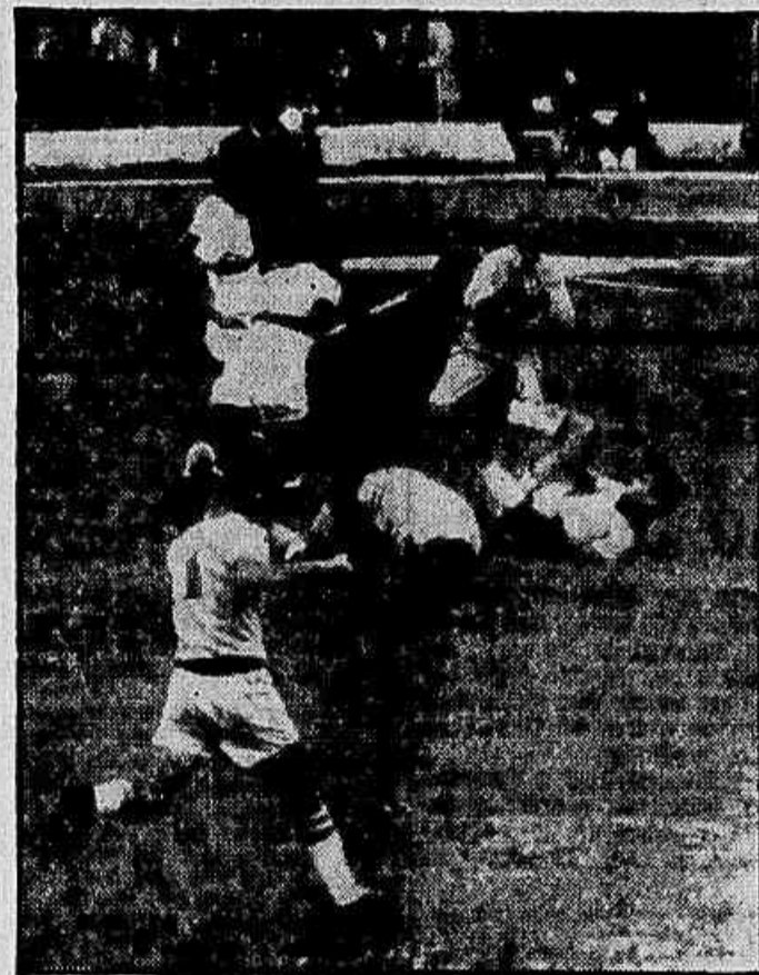
Os brasileiros continuaram investindo, tentando o gol através de lançamentos de profundidade para Manuelzinho e China. Aos 35' o centroavante do Flamengo entrou pela área, passou pelo médio Agudelo e ia marcar, quando o goleiro Lopera saltou a seus pés e auxiliado por Acevedo e Echeverri, que interferiram no lance por trás, deteve a bola. O juiz Ramiro Garcia, infelizmente, nada marcou. Estas duas fotos são o lance do pênalti e o seguinte.