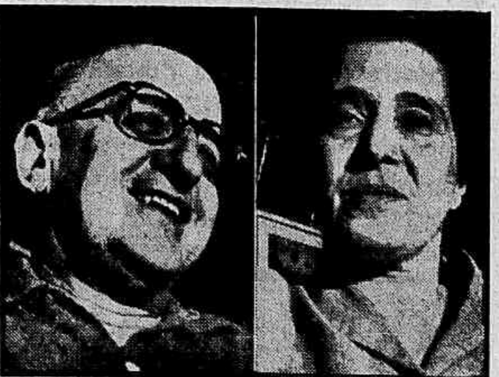
Unidos na morte, como o foram em vida, Otávio Tarquínio de Sousa e Lúcia Miguel Pereira, desapareceram de maneira trágica, deixando profundamente consternados seus parentes, amigos, e toda a família intelectual brasileira