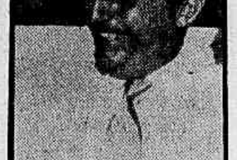
RADIALISTA Vitor Costa, pioneiro do rádio no Brasil, está sendo sepultado hoje em São Paulo.

Com esta providência, o chefe do executivo mineiro espera, até o fim do seu mandato, pavimentar mais de três mil quilômetros de rodovias, bem como abrir novas estradas, por todo o Estado.