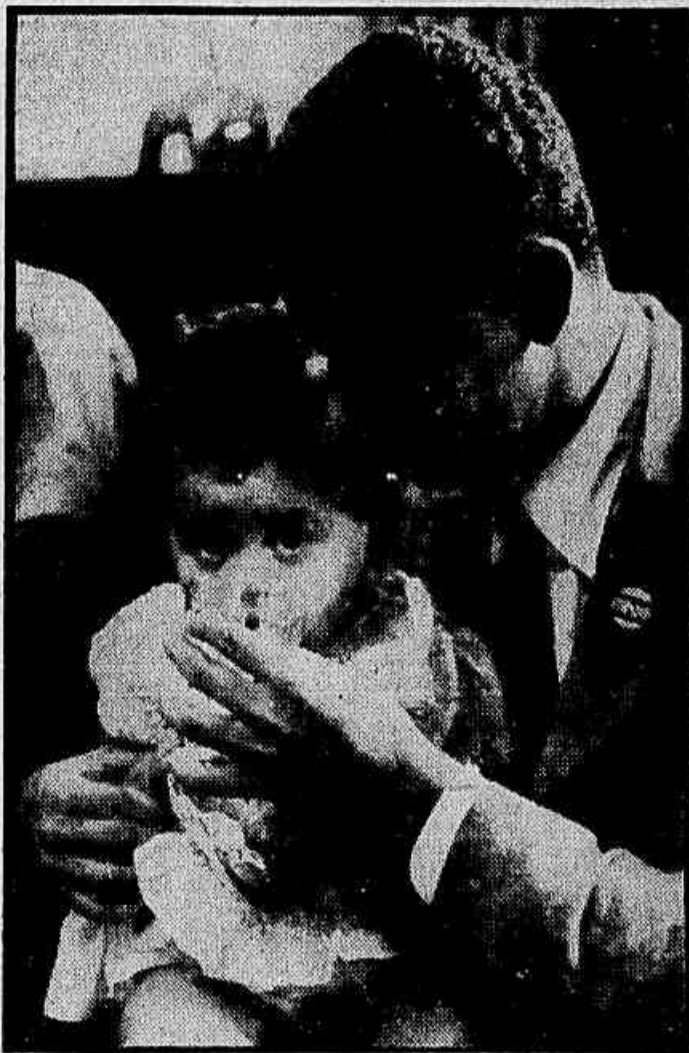
No gabinete do sr. Lídio Lunardi, diretor do Departamento Nacional do Serviço Social da Indústria, foi procedida ampla distribuição de presentes aos filhos dos servidores da instituição, a exemplo do que ali sempre se faz por ocasião do Natal. A foto acima fixa um flagrante no ato.