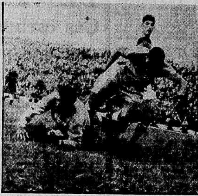
Mesmo inferiorizados no marcador os brasileiros não esmoreceram e continuaram atacando, a ponto de El Espectador ter dado em manchete: "Brasil demonstró ser um gran equipo, pero acusó los rigores de su viaje". Fatigados, e visivelmente esgotados, os brasileiros ainda tentaram diminuir a contagem, só não o conseguindo pela segurança da defesa contrária.