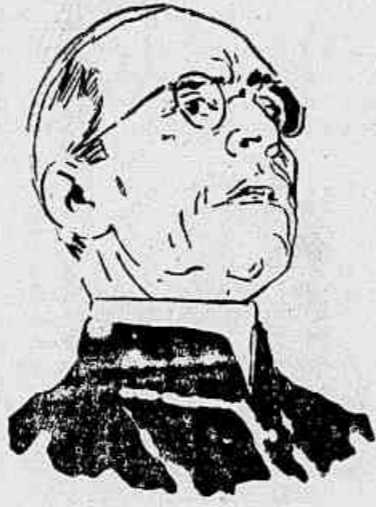
S. Santidade Pio XII

O honrado sr. Salgado Filho não percebeu que a legislação está morta e que o país tem de aturá-la em cima da mesa, num interminável velório. Doi o êro de sua generosa conceituacão gobando as atividades de um defunto, cujo trespasse, aliás, o país acolheu com um sorriso satisfeito.