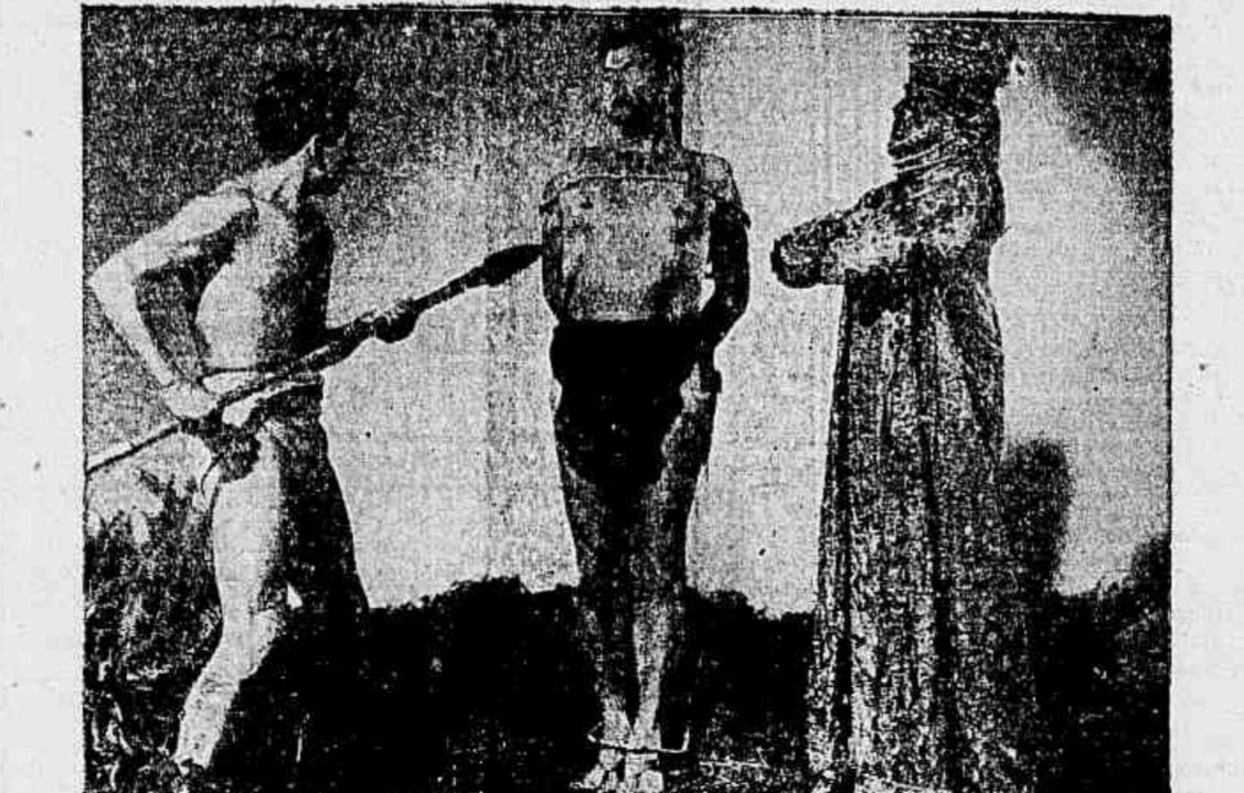
John W. Muller numa cena do filme "Tarzan e as Sereias"

A nova aventura de Tarzan apresenta o homem-bêta voltas com "Aquatania", uma cidade dominada pelo paganismo e pela superstição! Tarzan, o ídolo de milhares de "fans", volta em mais uma emocionante aventura, "Tarzan e as sereias" (Tarzan and the mermaids), mostra-nos o herói das selvas, desafia o ódio de um pseudo deus nativo para salvar uma linda princesa! Johnny Weissmuller, Brenda Joyce, Andrea Palma, Linda Christian, Gustavo Rojo e outros fazem os papéis principais. Este filme oferece um momento de intensa emoção: Tarzan em luta contra um medonho polvo, unindo suas derradeiras forças a fim de escapar aos terríveis tentáculos do monstro marinho! Para recrear a vista, porém, temos também um pouco de beleza: um grupo de belíssimas sereias, em grandes evoluções aquáticas. "Tarzan e as sereias" estará nos cinemas Plaza — Astória — Olinda — Ritz — Star — Primor — Republica — Colonial e Mascote a partir de hoje. E hoje mesmo, à meia-noite, haverá sessão de Ano-Novo nos cinemas Plaza — Astória — Olinda — Ritz. Enquanto isto, atendendo à insistência do público, o Parisiense continuará exibindo até a próxima semana, as novas maravilhas de Disney, "Canção do Sol" e "Volta do Arcação".