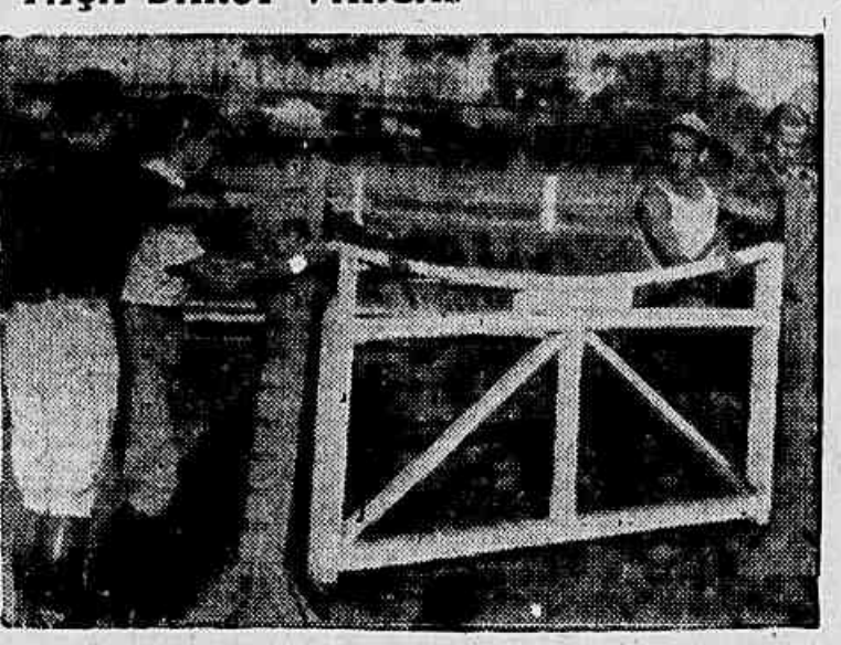
Aspecto tomado nas eliminatórias da Sociedade Hippica Brasileira

O estadio do America F. C. já está recebendo as necessarias adaptações de pista e vistosa ornamentação para o grande torneio hippico que all se realizará a 10 do corrente, por iniciativa da Sociedade Hippica Brasileira e sob o patrocínio da sra. Darcy Vargas, em beneficio da Casa do Pequeno Jornaleiro. Denominar-se-á, por isso mesmo, "Casa do Pequeno Jornaleiro" a prova organizada para esse concurso, do qual participarão elementos dos mais destacados do hippismo patrio.