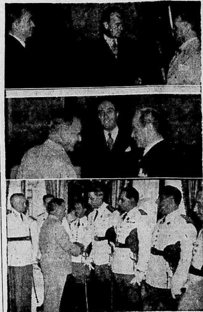
NO CATTETE — O embaixador FLAGRANTES DE HONTEM, m de Roosevelt, o embaixador Caffery entregando a mensagem...

Em Palacio o Embaixador Carlos D'Avila — Apresentados ao Presidente os Officiaes Promovidos Por Merecimento