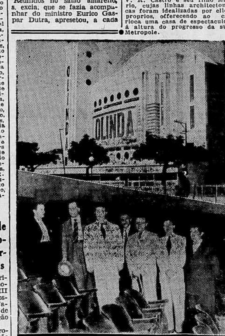
Em uma fachada do sumptuooso palacio, em baixo um aspecto interno e os proprietarios da Olinda...