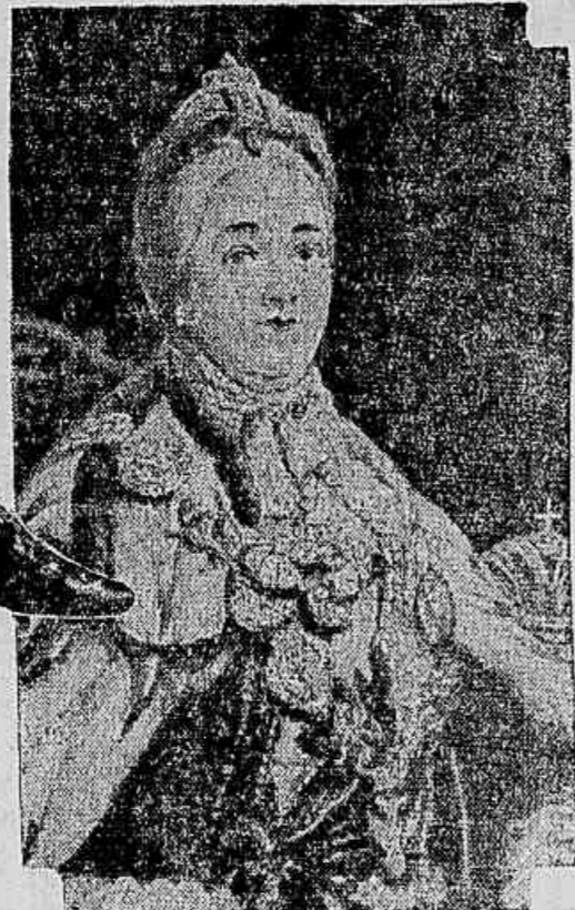
Catharina, a grande, da Russia, que é conhecida na Historia como não tendo encontrado o homem que idealizava