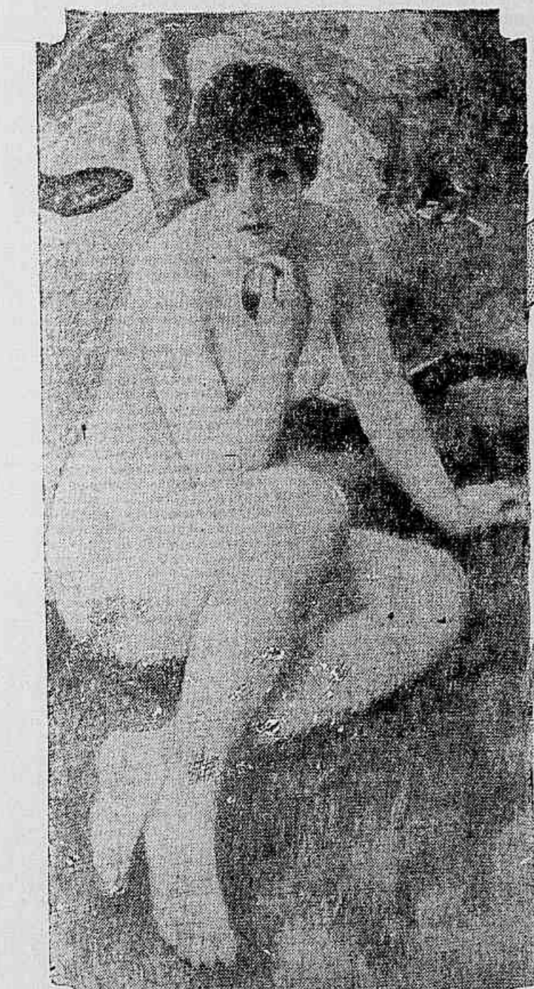
Eva, a maçã e a serpente. Reprodução de um quadro de Riché...

Elle era de um temperamento aggressivo, tanto a capacidade de fazer mulheres face a face com ellas, agarrava os seus discipulos pela