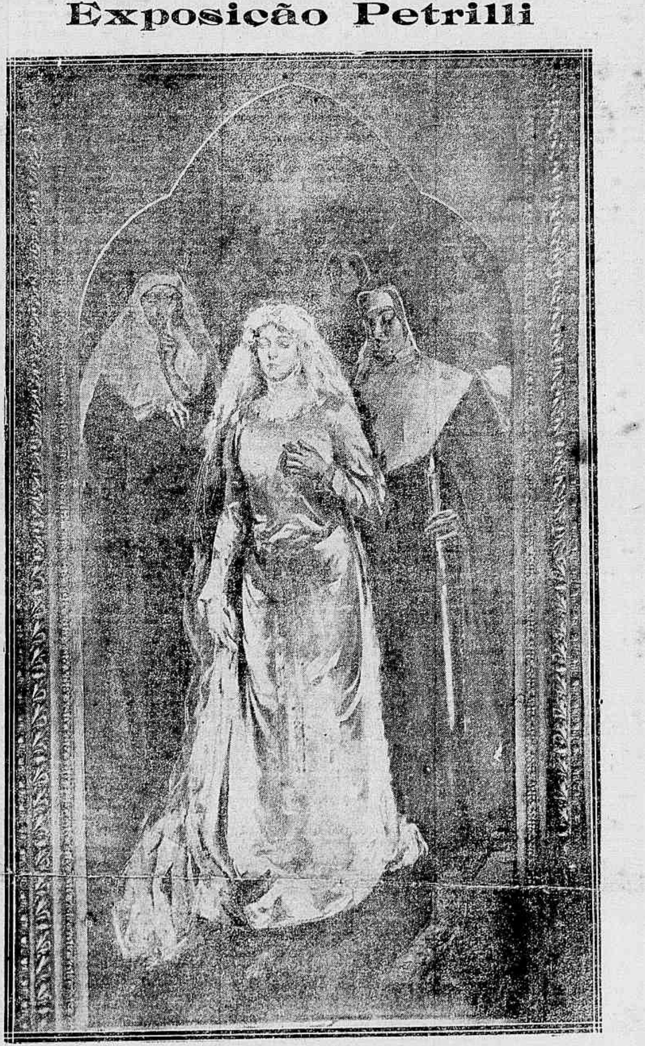
La sepolta viva — o notavel quadro que alcançou em Napoles, no anno passado, um grande successo, tendo sido adquirido para a celebre 'Galeri 1' daquella cidade