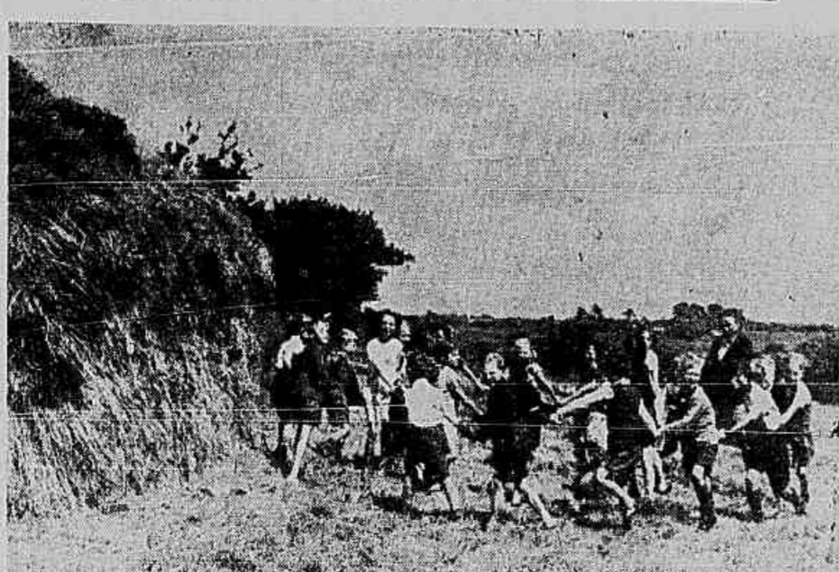
LONGE DO PERIGO — Creanças dos subúrbios de Londres, que por motivos da evacuação procuraram refugio no interior da Inglaterra e nas zonas agrícolas, divertem-se, depois das horas de aula, num campo desmbarcado pelas colheitas do anno.

Londres, 2 (U. P.) — Os alemães aéreos atacaram em massa contra Londres e zonas estratégicas das Ilhas Britannicas. Foram hoje rechassados com todo o êxito pelos "Spitfires" e "Hurricanes", a despeito da maior intensidade das incursões inimigas. Por volta das 15 horas, caças extra-oficiais faziam ascender a 20 o número de aviões alemães já derrubados e a mais de 500 o dos aparelhos de bombardeio e de caça germanicos que participaram dos ataques por grupos.