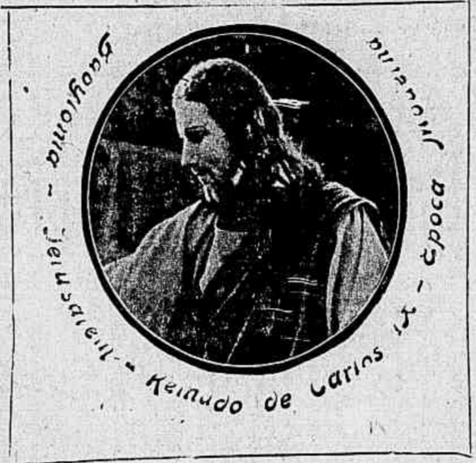
Epoca - 4 - Epoca - 3 - Epoca - 2 - Epoca - 1 - Epoca - 0

Sciencia, a Historia, as artes plasticas e decorativas, tudo isso harmoniosamente combinado para recrear a vista, acordar a reflexão e enlevar o espirito.