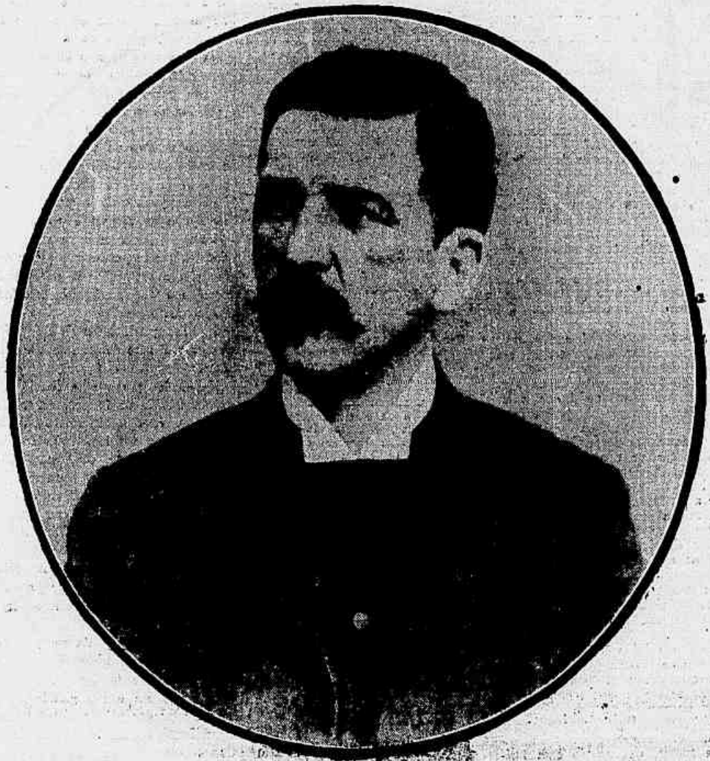
DR. WENCESLAO BRAZ