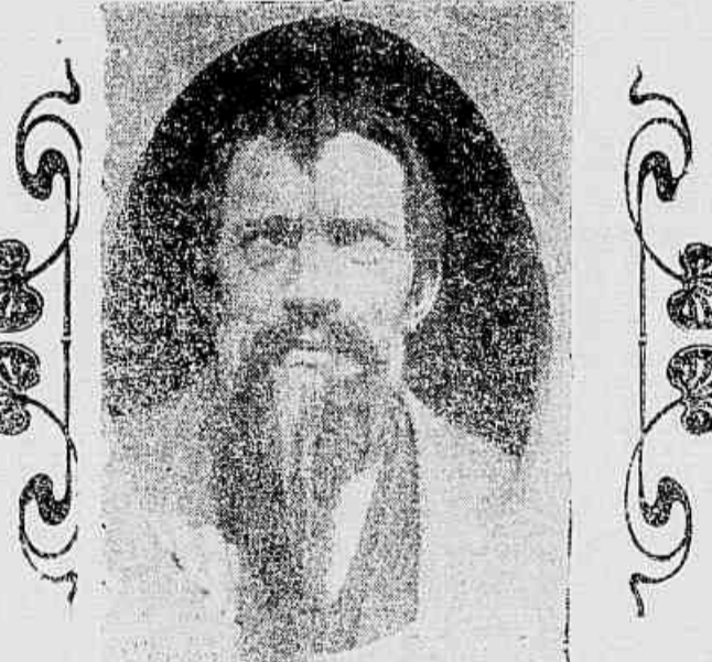
RODGAR DE BASKERVILLE O BANDIDO

TERCEIRA PARTE O MYSTERIO DA CASA DO LAGO Sherlock Holmes pressa a seguir a casa de Rodgar de Baskerville, onde se estabeleceu com sua esposa e filho. Mas Rodgar não se entregou, e fugiu para a ilha de Baskerville, onde se estabeleceu com sua esposa e filho. Mas Rodgar não se entregou, e fugiu para a ilha de Baskerville, onde se estabeleceu com sua esposa e filho.