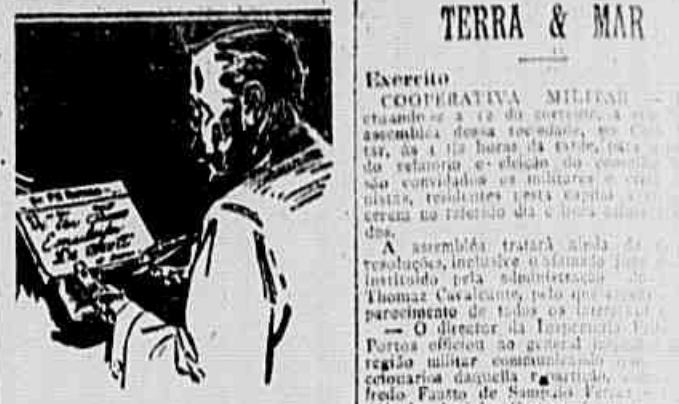
TERRA & MAR