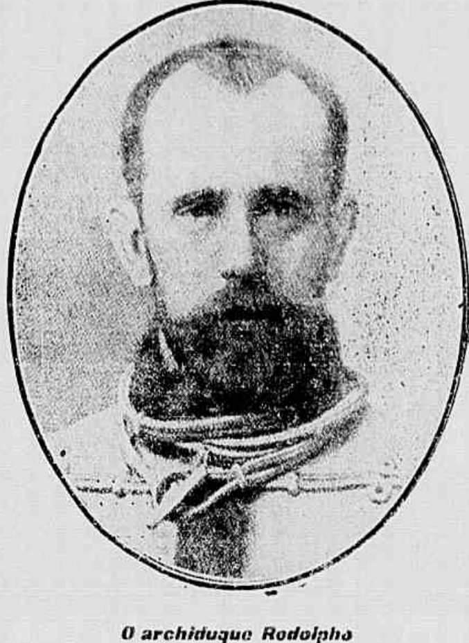
O archiduque Rodolpho

Francisco Fernando e sua mulher, salvos do primeiro attentado, continuaram a sua viagem para a Camara Municipal. O príncipe ouve ali uma saudade de boas vindas, pronunciada pelo burgomestre, e depois retornou a seu auto para ir ao Konak, palacio do governo.