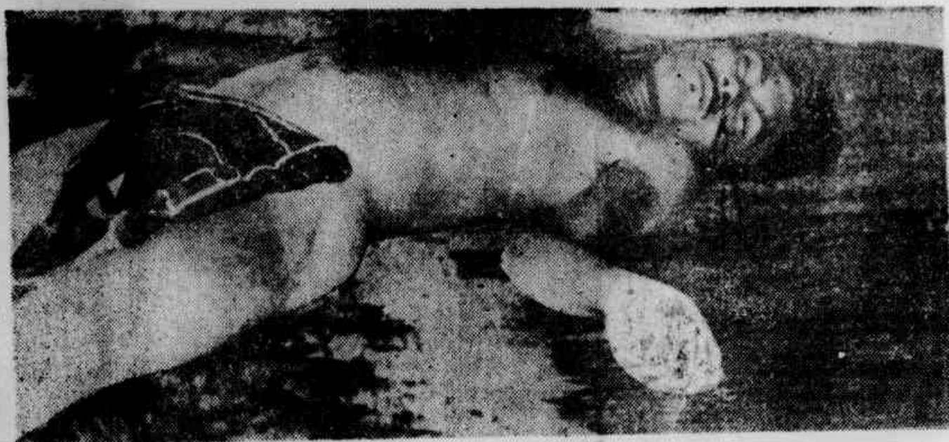
O jovem encontrado morto com um tiro na nuca e que ainda foi seviciado por seus algozes

★ Estava bem barbeado e tinha as unhas esmalgadas ★ Seu shorte foi encontrado três metros distante do corpo ★ Matadores levaram toda roupa ★ Aparentava 23 anos ★ Local ermo e de encontros de namorados ★ Próximo fica antro de assaltantes e maconheiros ★ (Na página 2)