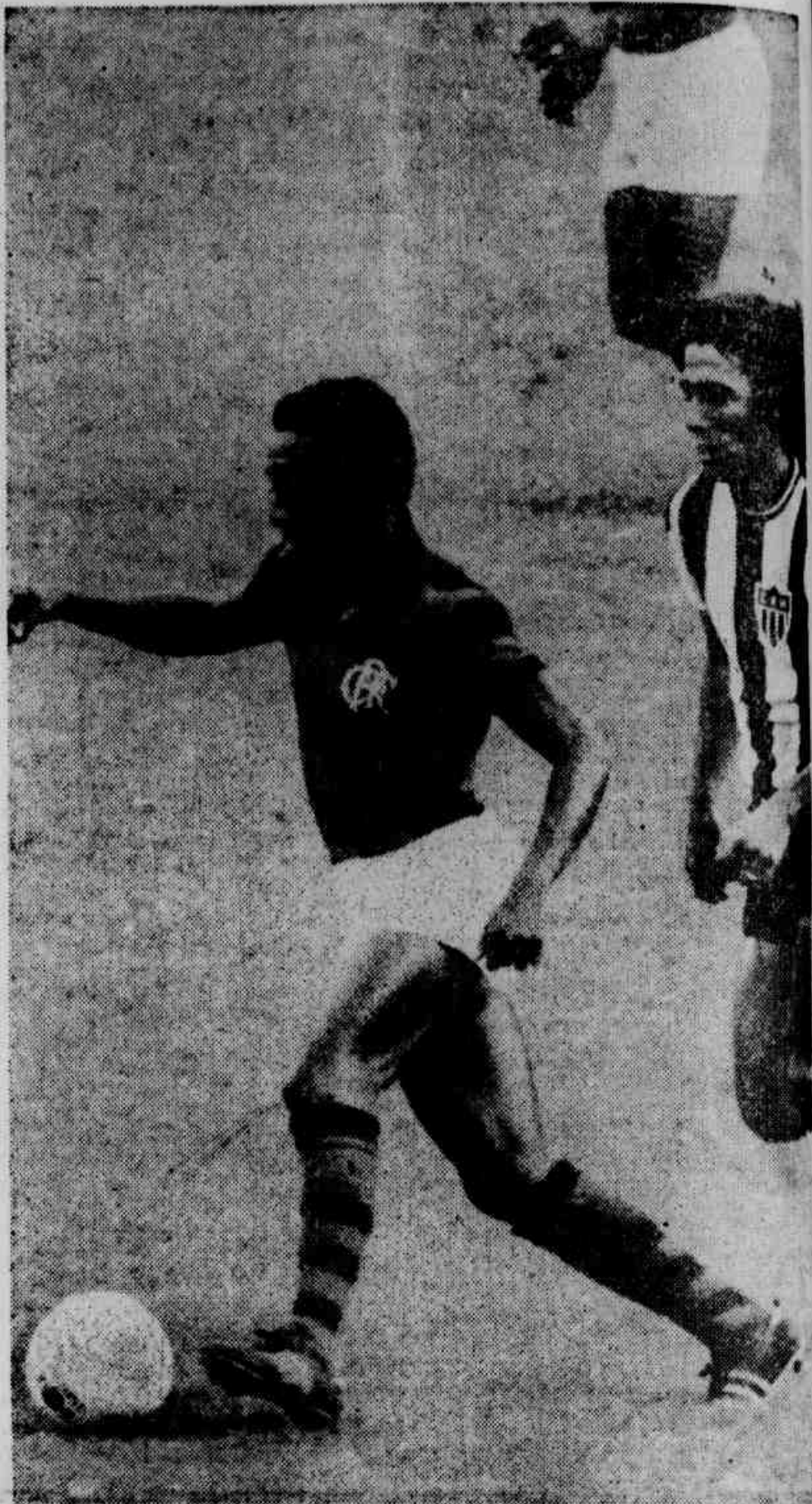
Paulo César forma com Dario a ala preferida do Presidente