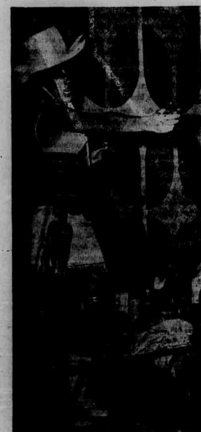
Ambiente requintado e mulheres bonitas deslumbraram os turistas. Sobre as mesas e cadeiras as fofonias esqueceram seu pudor. Apareceu esta linda "distoleira" de ar feroz mas pouco convincente. Atirou em todo mundo, de brincadeira.