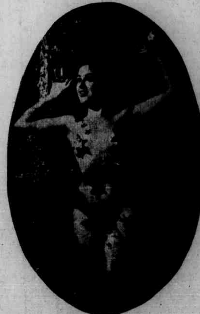
□ Assim era Virgínia Lane, a pequenina e buliçosa vedete que Válder Pinto apresentava em "Muié macho, sim Sinhô!". Comentava-se na época um romance entre a estrela e seu empresário. Seu nome, na fachada do Recreio, era a razão do grande sucesso da espetacular revista, a melhor de 1950.

Hoje, o nome de Válder Pinto é a legenda de um sucesso que ninguém conseguiu superar. O arrojado e a apoteosidade de suas produções, fantasia colorida da sua imaginação, brilham ainda em nossa lembrança, como uma recordação dos bons tempos que não voltam mais.