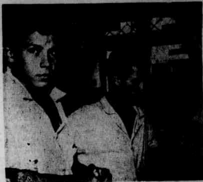
Os dois empregados da Sorveteria, que nada passaram fazer, em defesa do patrão, quando falavam à reportagem.