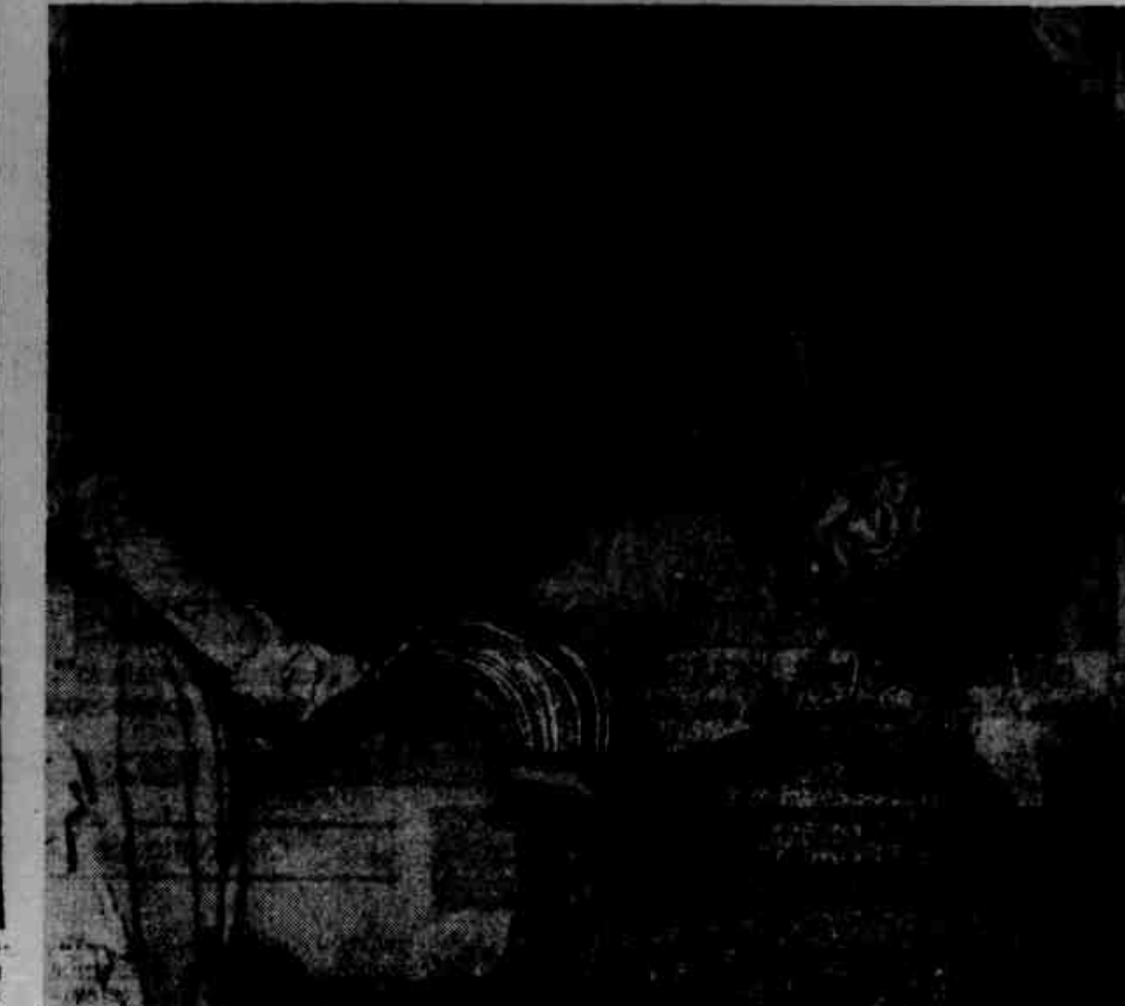
Os beijos foram uma constante nos bailes de gente bem. Ninguém respeitou o decôro, porque criou-se uma mentalidade de que no carnaval vale tudo, ou quase. Este casal, por exemplo fez ouvidos de mercador às determinações das autoridades policiais, que proibiram terminantemente tais cenas.

A mais nova piada paulista é a de que existe quarta-feira de cinzas porque o carnaval é uma "brasa". Nos grandes bailes oficiais, Glória, Copacabana Palace, Municipal, Quitandinha, Floresta, onde esses flagrantes foram colhidos, pois os preços altos não pesam para os grã-finos nem para os "penetras" que os freqüentaram, e, sobretudo, muitos beijos e agarramentos, que fariam corar um frade de pedra ou justificariam a retirada do salão, num baile de clube de bairro. Não precisamos escrever muito a respeito. Os leitores que tirem suas conclusões, pelos flagrantes colhidos.