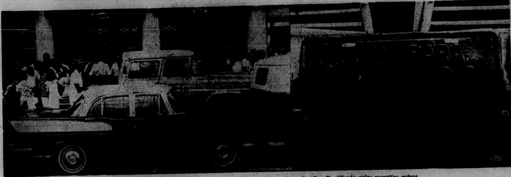
A sorveteria onde ocorreu o covarde crime, tendo-se, ao lado, a chapa da "Rural" utilizada pelos suspeitos presos.