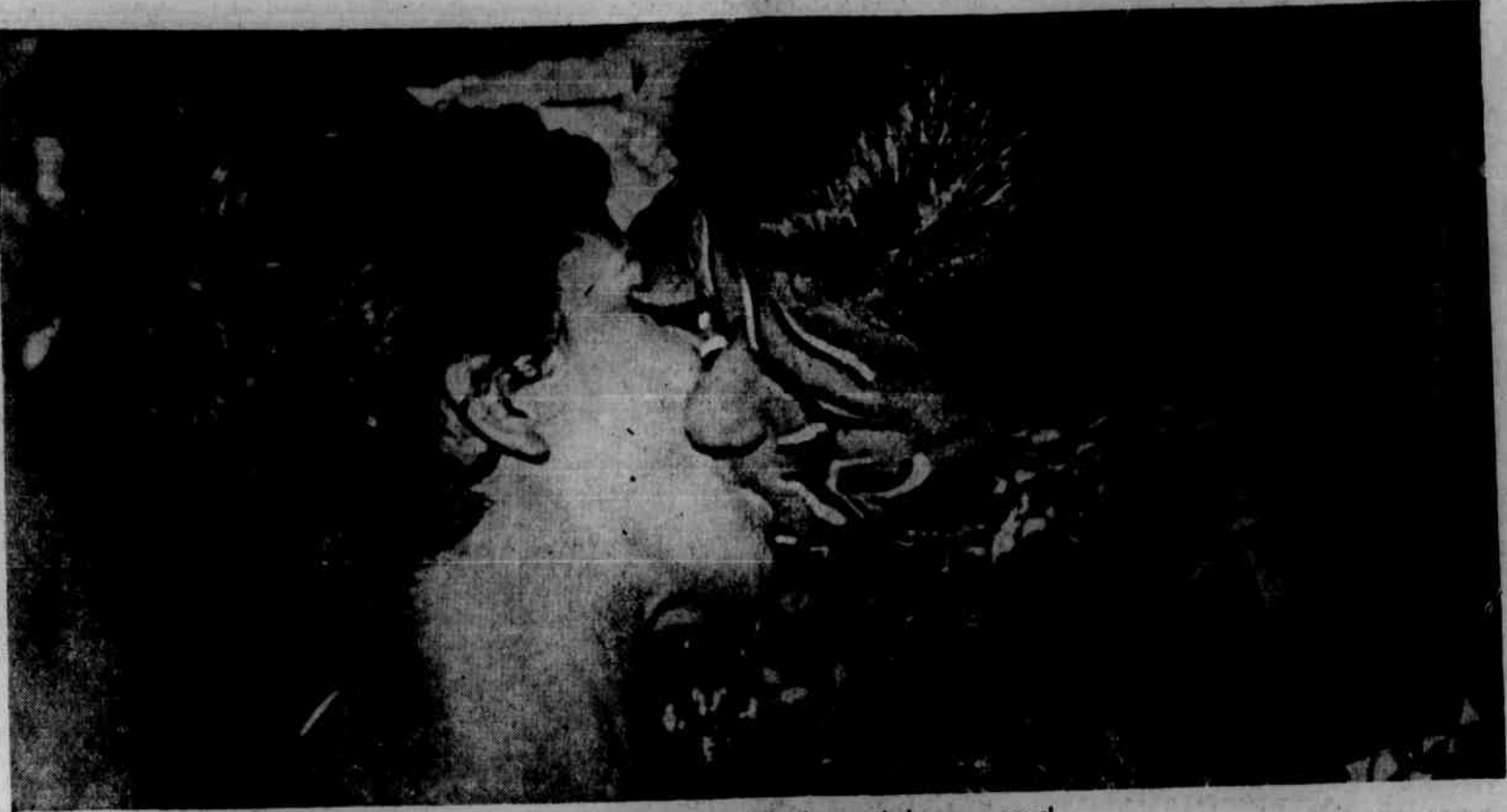
□ Isto é mais que um beijo de namorados. Omitimos a adjetivação porque seria incompatível com o moral.