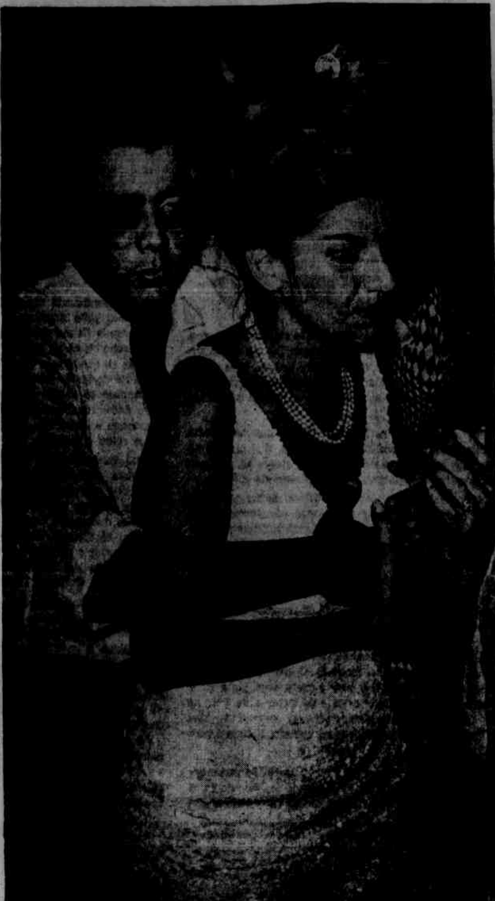
O folião arrancou o paletó do 'smoking' e colou no samba. Sua fisionomia reflete o seu estado etílico. Parisso, talvez, não respeitou sua acômpnhante e tratou de colocar as mãos em lugar proibitivo.

CAXIAS CAXIAS — Tormenta no ring. PAZ — A história de um homem mau. NOVA IGUAÇU NOVA IGUAÇU — O marão de Damasco. NITERÓI CENTRAL — Quando floresce o amor. ALAMEDA — Búfalo Bill, o investível e Valência rural. NITERÓI — Tormenta no ring. NITERÓI — Espíritos indômitos. GOEON — A história de um homem mau. S. JORGE — Bandido do Rio Vermelho. PETROPOLIS CAPITÓLIO — Shandooah, parafic perdido. S. PEDRO — Tormenta no ring. VILA MERITI GLORIA — Operação comunista e Hércules contra o corsário. S. JOAO — O mundo axxy.