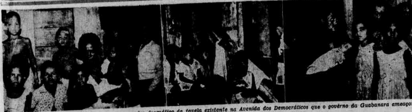
Mulheres e crianças doentes formam o quadro dramático da favela existente na Avenida dos Democráticos que o governo da Guanabara ameaçou despejar, pela força