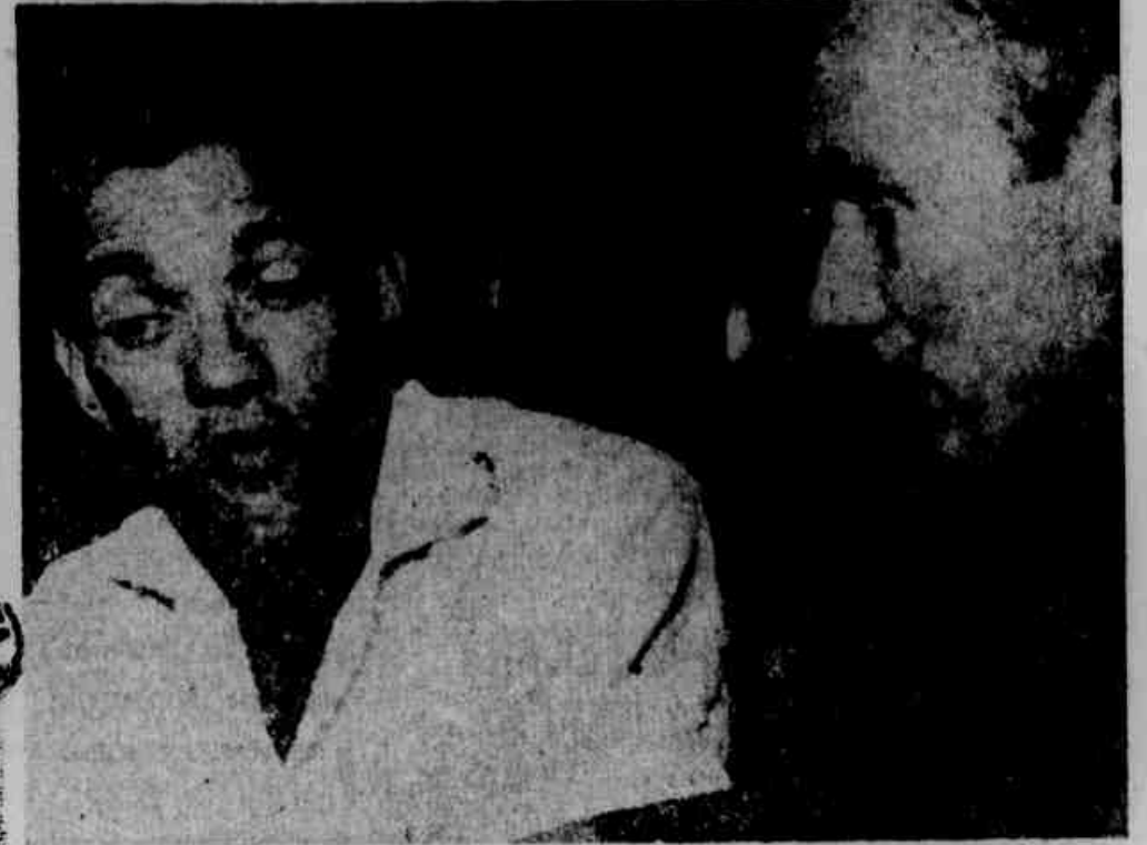
O grande craque Garrincha, quando falava à nossa reportagem

A BRIGA Entrando na casa, os cunhados dirigiram-se a Garrincha de maneira violenta e o jogador não gostou. Seu protesto, motivou uma forte discussão, que terminou em briga, tendo os revoltados rasgado as vestes da cantora, só não a espancando (Conclui na 2.ª pag.)