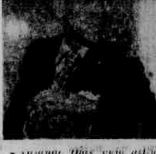
♦ O indoloso craque que desapareceu tragicamente nas águas da Barra da Tijuca

Ao entrar no Distrito, deu muito que fazer aos policiais Macanhado, provocou baderna, sendo, finalmente, dominado. O assaltante foi autuado, por desacato.