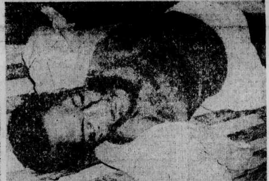
O corpo do homem, ainda não identificado, foi encontrado morto nos fundos do cemitério de Olinda