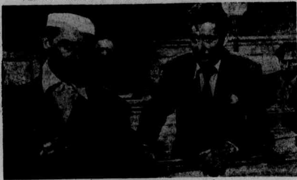
Cary Grant e Ronald Colman (já falecido) são dois dos veteranos de Hollywood que brilham na comédia "E a Vida Continua!" (The Talk of the Town) que a Cia. Cinematográfica comprou à Columbia, para reapresentação, no Brasil, e está fazendo sucesso esta semana no circuito Paris-Palace - Patissandu - Rio-Palace e com a continuação garantida para os próximos sete dias de cinema. É, realmente, uma comédia que agrada de ponta a ponta, revelando que Hollywood hoje em dia não faz mais coisa igual, tão divertida, tão humana e tão inteligente. A heroína é a talentosa Jean Arthur e entre os coadjuvantes temos o ex-"cow-boy" Tom Tyler, que vemos na foto acima, ao fundo.