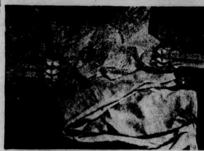
As vestes de Ivã e um par de sandálias de uma das jovens que pereceu afogada, na Barra da Tijuca