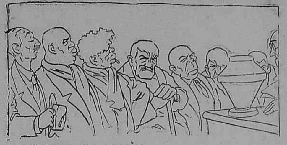
Sr. Filiano dos Anzões e Carapuzas!