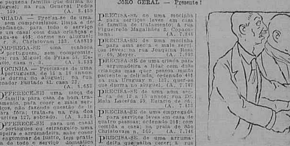
Perdió! Filiano dos Anzões e Carapuzas não eu!