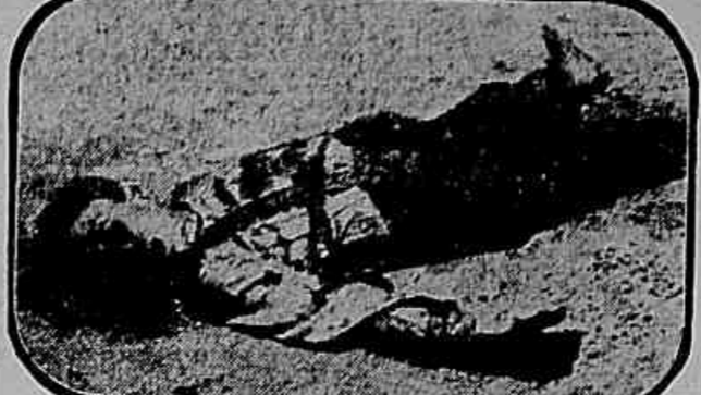
O infeliz Claudio Dias