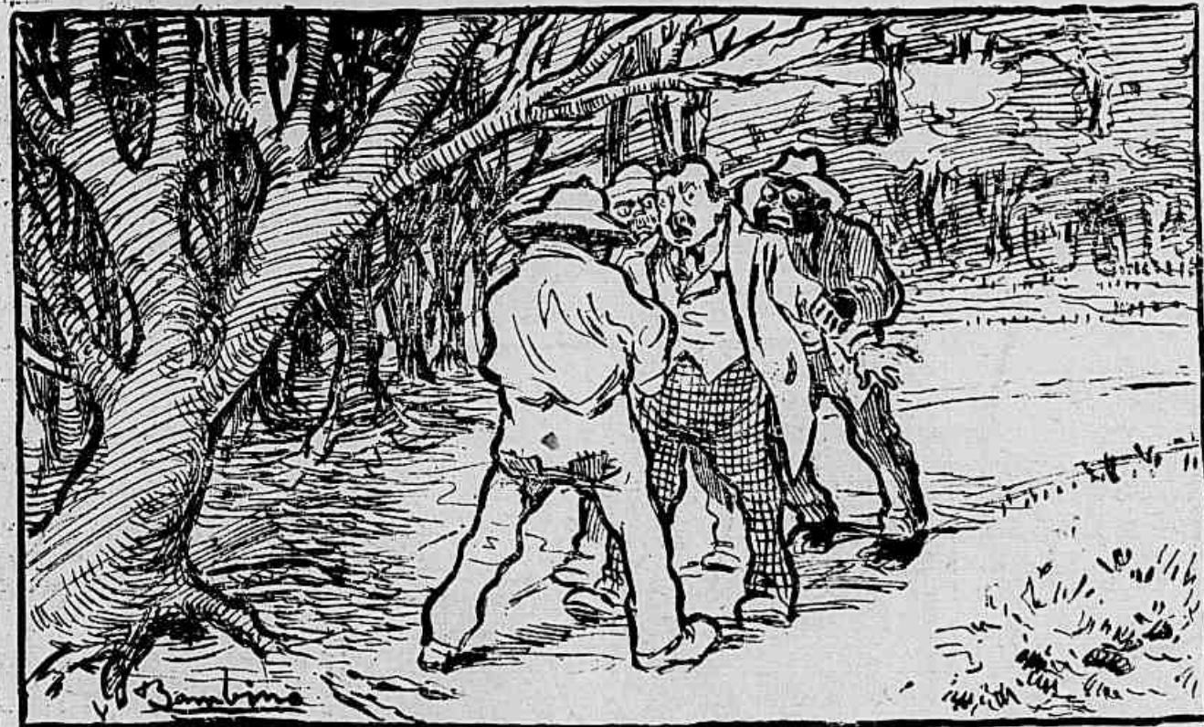
Do que escapou o Presidente da Republica

Fontaineblau sabem perfeitamente bem, vir cada dia até a balustrada onde o publico se reúne para lhes atirar pedagos de pão, e mostram-se sem o minimo receio á flor d'agua. Tomemos, ao contrario, um peixe não domestico, no primeiro riacho que encontramos; elle foge, qualquer que seja o alimento que se lhe dê, desde que percebe a sombra de um homem n'agua transparente. E, a experiencia é facil de fazer com uma desses peixes vermelhos tão conhecidos; a principio espantamos, depois virão facilmente tirar dos dedos a migalha de pão que ali estiver.