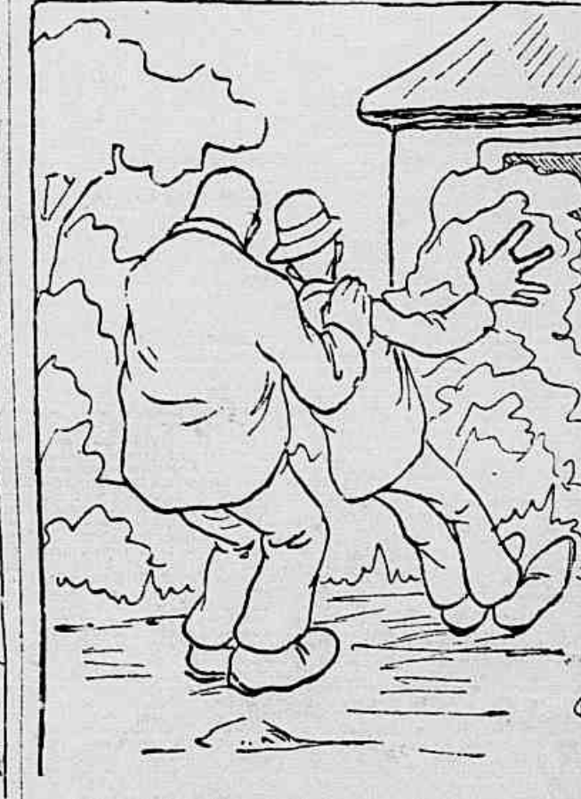
Sultico, o fazendeiro quasi desmaia de alegria nos braços do amado genro; este tambem sentiu enchidos de satisfação cecognita e regozijante; da casa junto ao cercado partiam vozes, e estas vozes eram de Dona Aguelia e de Filina. — Ora graças! exclamaram os dois ao mesmo tempo. RAUL.