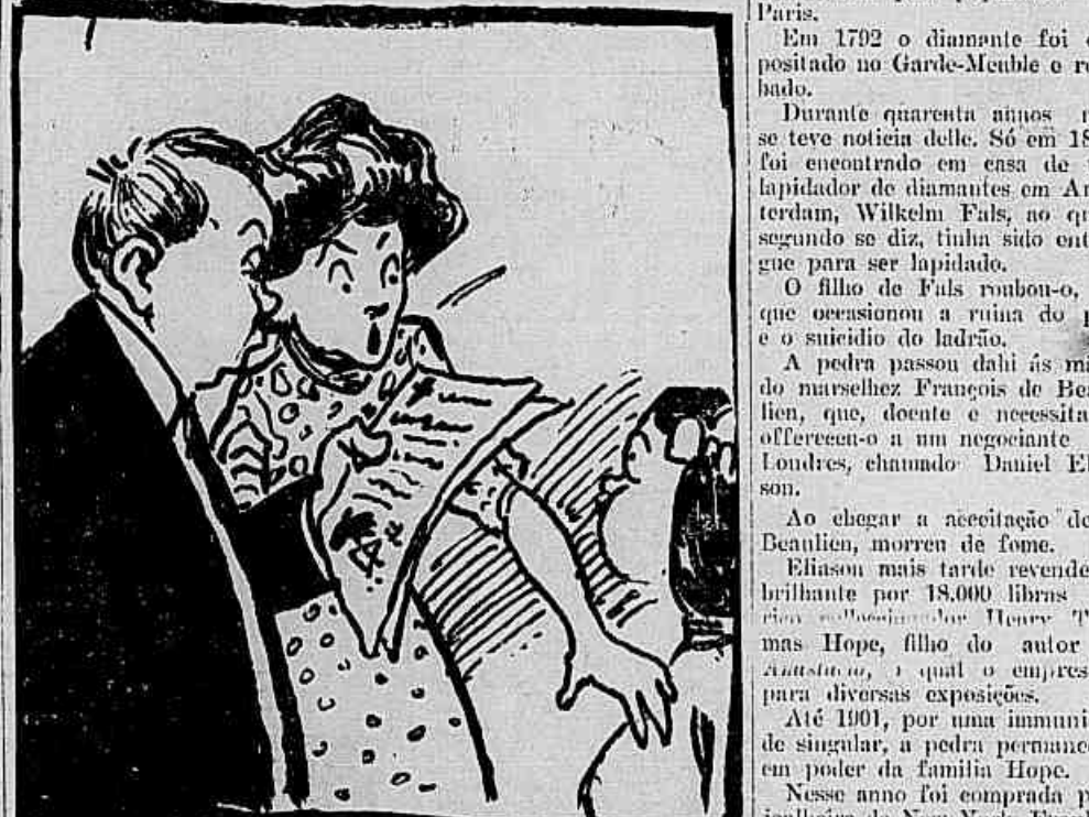
Effectivamente, o plano deu o resultado que esperava, porque o nosso heróe, fingindo afubação, entra em casa, chama a cara metade e lê em sua presença a carta, que constava de uma intimação, sob a ameaça de um attentado aos armazéns... Depois disse-lhe que mal tinha tempo para jantiar, pois que precisava avisar a policia, quanto antes!

mittiu-lhe adornar-se com a valiosa pedra, mas, estranha coincidência, no dia em que come-