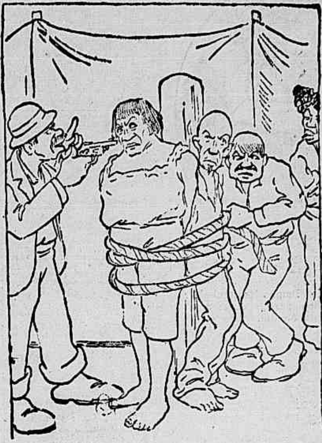
Ali chegados, encostados a um formidável tronco, foram logo amarrados com grossos cabos de linho por duas mulattas que estavam atrás do tapume. O fazendeiro recebeu um tratamento inquisitorial e o genro, apesar de ter amarrado, procurava achar jeito de dar um tranco ou um troupezo no homem do revólver.