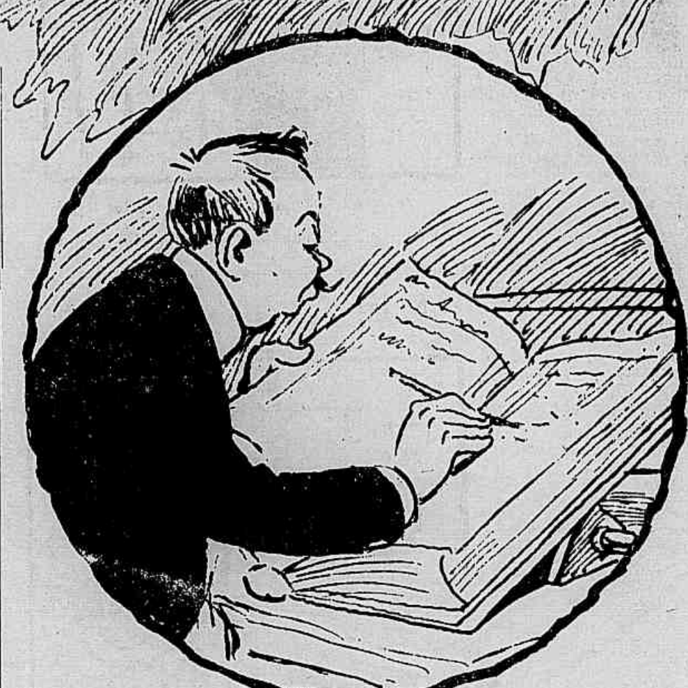
O Juca Peroba era o modelo dos casados e um excellente guarda-livros, socio de importante casa commercial. Passava os dias trabalhando e quando terminava o expediente, corria direito á residencia, onde o esperavam mulher e filha. As noites nunca pa sciava e as poucas vezes que isto acontecia, era sempre acompanhado pela familia.

Essa historia, enormemente tragica, envolve assassinatos, suicidios e outros desastres e foi boa parte ella, não fosse publicada antes da venda porque o seu