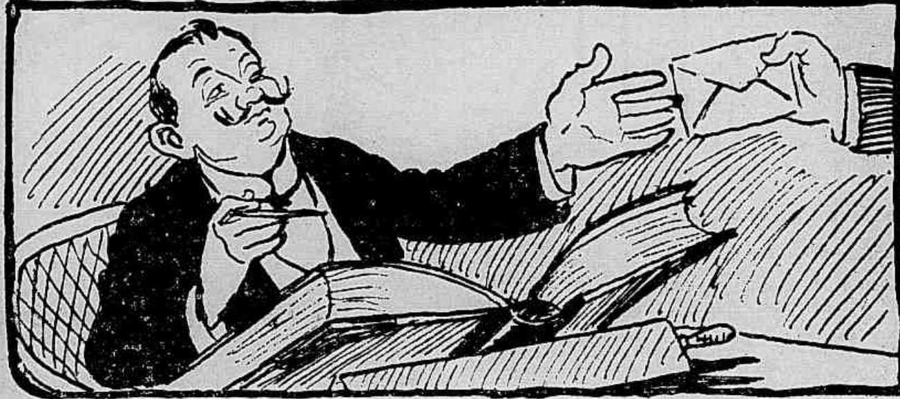
Mas, como não ha bem que sempre dure... Um bello dia o nosso Modelo recbe no escriptorio uma carta de uma antiga constituinte, no qual, depois de algumas expansões de affecto, lhe pedia que fosse, naquella noite, visitá-la, afim de tratarem de negocios de mutuo interesse...

mesmo cheinei a ver quem tão infamemente me insultou! Neste momento nelavamos-nos, por uma coincidência singular, a pequena distancia da rua que vae ter ao portão de sahida, quando, á luz dubia de um candieiro, Alberto viu passar uma joven vestida de branco e ao lado della um homem, caminhando ambos apressadamente. — Conheci-a! E' ella! — exclamou — Sem duvida, o homem que a acompanha é o meu aggressor. Corramos, Alvaro.