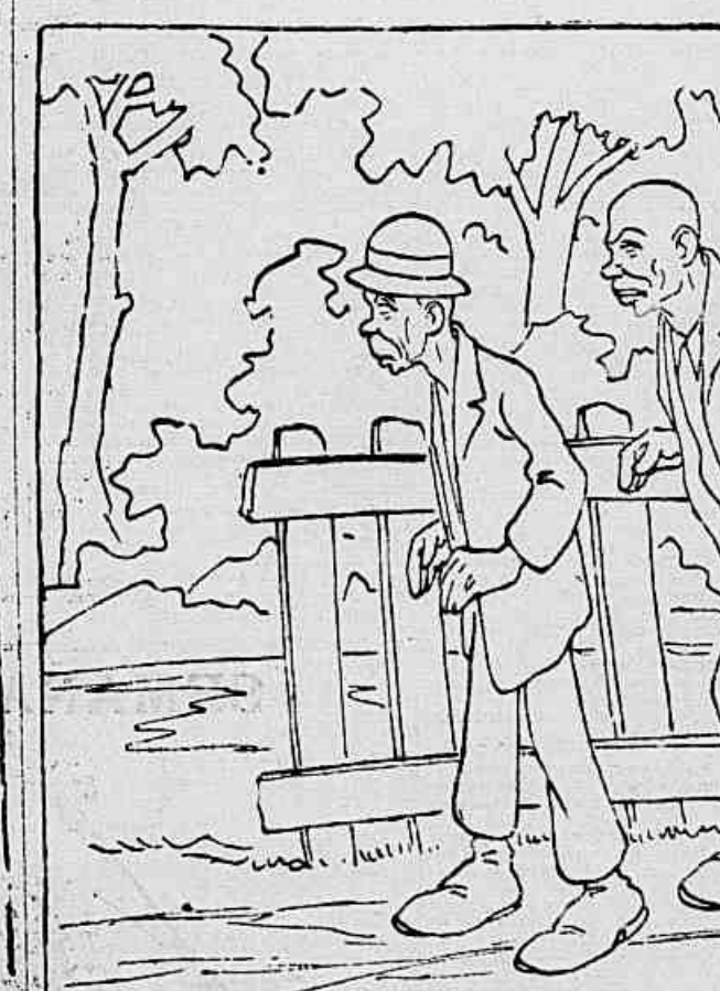
E saindo do espederijo, raspuram-se os dois ruspados sorratoriamente, multiplicando todas as cautelas para que não desconçassem de suas pessoas. Andaram assim sem serem percebidos durante uma meia hora bem puxada até um cercado toco, que indicava o começo de um sitio de importancia.