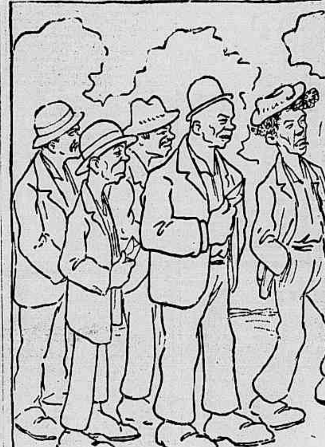
E lá seguiu o grupo uniformizado, a juntar-se ao grupo numeroso dos votantes.