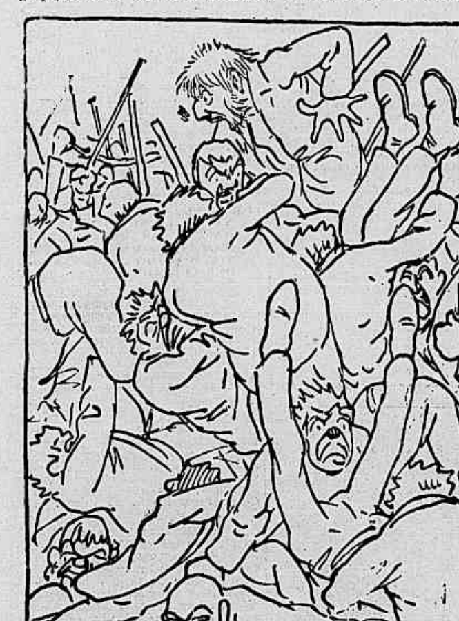
El a cousa degenerou em sarilho grosso, salientando-se o presidente da mesa, que andou em bolandas pelos ares, bem contra a sua vontade, enquanto o bolo de gente andava nos francos, entre copapos, pauladas, chibatias, tiros, gritos, apertinhos, desconposturas, calçadas, rastelas, ponta-pés, cambalhotas e outras onomatopéias esbordantes.