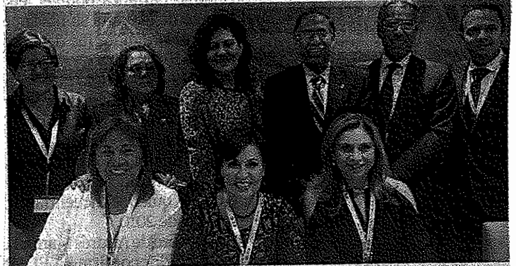
La titular de Sedatu, en Hábitat III

Después de haber avalado la Miscelánea Fiscal y la Ley de Ingresos, el próximo martes los diputados se alistan para las comparecencias de los secretarios de Energía, Pedro Joaquín Coldwell , por la mañana, y en la tarde los visitará el titular de Economía, Ildefonso Guajardo . En San Lázaro, nos dicen, ya no habría pretexto para posponer más estos encuentros como se hizo por el desahogo de la Ley de Ingresos para 2017, por lo que don Pedro y don Ildefonso esta vez sí tendrán que presentarse ante los legisladores para hablar de algunos de los temas espinosos de ambas Secretarías.