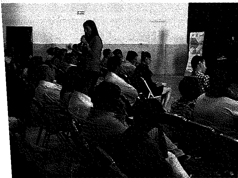
Res. Inauguran talleres en materia electoral para ciudadanos.

Mazari Espín aseguró que el recorte para 2017 está acotado para el Poder Ejecutivo Federal, por lo que los diputados serán vigilantes para que el Gobierno se abroche el cinturón como lo establecido la Presidencia de la República, “se ha dicho que habrán de hacerse ajustes en el gasto corriente, pero no que tengan afectaciones directas en los ciudadanos”. ◻