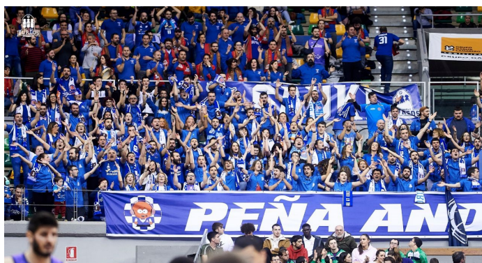
El cronista y sus compañeros con los aficionados de la peña Andrés Montes