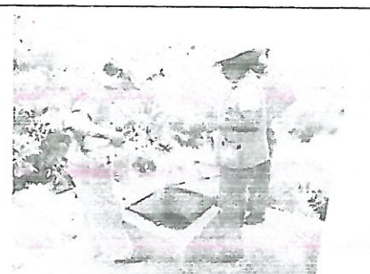
MUNICIPIO: AYUTLA DE LOS LIBRES LOCALIDAD: EL GUINEO ACCIÓN: CLORACION DIRECTO AL TANQUE