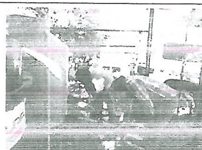
MUNICIPIO: AYUTLA DE LOS LIBRES LOCALIDAD: AYUTLA ACCIÓN: SUMINISTRO DE HIPOCLORITO DE SODIO