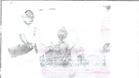
MUNICIPIO: AYUTLA DE LOS LIBRES LOCALIDAD: ATOCUTLA ACCIÓN: INSTALACION DE EQUIPO RUSTICO