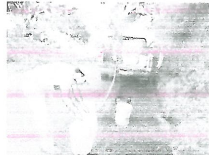
MUNICIPIO: AYUTLA DE LOS LIBRES LOCALIDAD: ATOCUTLA ACCIÓN: SUMINISTRO DE HIPOCLORITO DE SODIO