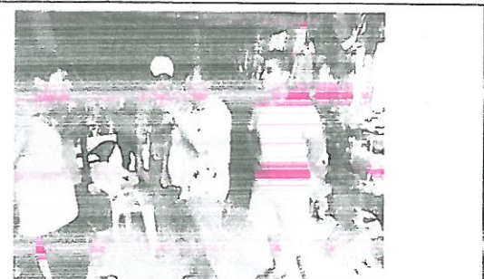
MUNICIPIO: AYUTLA DE LOS LIBRES LOCALIDAD: EL MEZON ACCIÓN: CAPACITACION SOBRE EL MONITOREO DE CLORO RESIDUAL