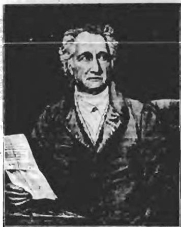
GOETHE (velho) — Quadro de Stieler

O mundo civilizado comemora este anno o centenario da morte de Goethe, maior poeta alemão e um dos genios mais completos que a humanidade tem produzido. A individualidade de escôlo do grande herôde da poesia, universalmente conhecida e admirada, é uma radiante gloria para a culta Alemanha. A vida de Goethe, que, toda ella, revela uma existência absolutamente normal e inteiramente sadia, abrangendo todas as espheras de actividade intellectual, representa o symbolo da perfeição da cultura da raça germanica. A sua carreira é a imagem de um desenvolvimento continuo e harmonico. Como poeta, politico e sabão, abraçou todo o conjunto de conhecimentos e interesses humanos. O seu genio manifesta-se na naturalidade, na formação interna de todas as actividades, na verdade sem restricções, no cumprimento fiel do dever, na força de vontade e virtude de renunciar e, finalmente, na habilidade de viver e é inabalável, pura e elevada na vida e o seu poder divino. E' o poeta da realidade, sensato e opportunista, isento de desejos ficticios ou sophismas.