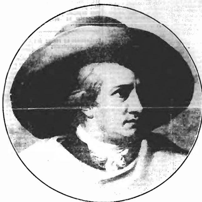
GOETHE (moço) — Do quadro de J. H. W. Tischbein

Atravessou a vida — vendo, sentindo e analysando. O mundo era lhe um livro maravilhoso, cheio de enigmas — que, como sabio, procurava decifrar — e de bellezas — que, como poeta, rimava. «E' certo que na minha longa vida — diz elle — produzi e realizei algumas coisas de que poderia acasos envaidecer-me. Mas, francamente, que tinha eu de realmente pessoal e de meu