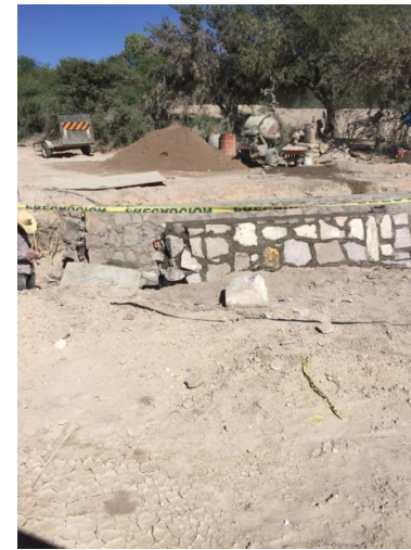
MAMPOSTERIA EN ALEROS EN OBRAS DE DRENAJE 2+680, 2+845 Y 3+062 ADEMAS MURO Y ZAPATA DE LA OBRA 3+650