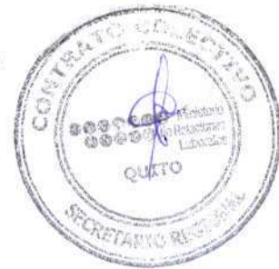
SECRETARIO REGIONAL DEL TRABAJO

LO CERTIFICO.- Dado en la ciudad de Quito a los 21 días del mes de diciembre del 2012.