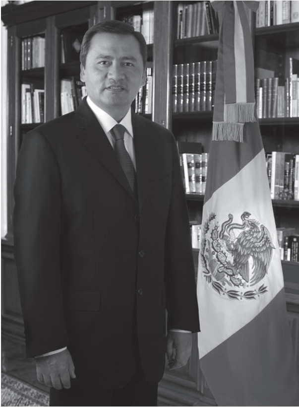
Miguel Ángel Osorio Chong Gobernador Constitucional del Estado de Hidalgo