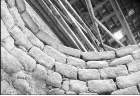
Uno de los tres hornos de yeso, visto desde el interior hacia la cubierta. S. XIX "Sequenero".

dad, funcionando diariamente durante el tiempo que trabajaron, podrían haber abastecido a una ciudad en régimen de expansión permanente. Estaban limpios y cuidados, esgrimiendo todavía en las paredes de bloques de piedra su estampado rojizo, en muestra de su añeja labor del pasado. Presentí el aura de cuantos moradores los utilizaron. Sin duda, habían sido orgullo emblemático de los sentimientos de cuantos los habían regentado y sus descendientes. Estoy convencido que son los únicos hornos de yeso, todavía en estado puro de conservación, que se encuentran erguidos, sin duda, gracias a sus propietarios.