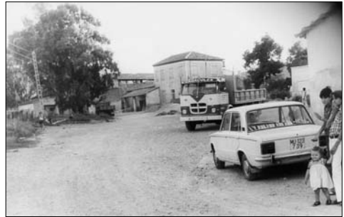
Camino de entrada a la yesera "El Caracoles", 1972.

trataba de hacerme una idea de cómo había sido el acceso que, desde su inicio, tuvo la yesera que funcionó en éste lugar; alma y corazón que recibió miles de toneladas de piedra extraída de las canteras de aljez traídas de los montes próximos del Carrascoy, transformándolas en ese polvo blanco, que amasado con agua, se convierte en una masa apreciada desde la antigüedad más remota para todo tipo de obra rustica, urbana y artística.