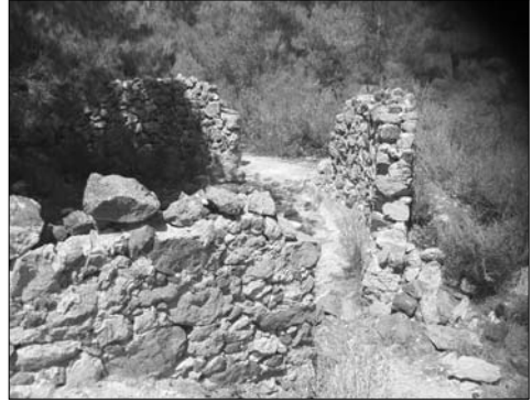
Horno de yeso Majal Blanco.

Los tres puntos concretos de la Sierra de Carrascoy son los que tienen una mayor proliferación de material de aljez. El que denominaremos "Los Teatinos", justo en la ladera Sur de Algezares; el referente a la Rambla del Valle, cuyos hornos están bajo el aparcamiento de la Balsa de Agua del Valle; y, en una lejana y relativa distancia de los primeros, citaremos al del Majal Blanco. Todos ellos conservan en sus inmediaciones los restos de típicos hornos de yeso, compuestos de gruesas paredes de piedra, en algunos casos incrustadas en la ladera del propio monte para acomodar una pendiente en su espalda que sirviera de camino para subir la piedra y volcarla sobre la parte superior abierta del horno.