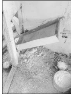
Criba de filtrado para obtener el polvo de yeso. Maqueta Sr. Jordán Murcia. Museo de la Huerta.

mente descubrió el material lítico para ser prefabricado obtenido de la piedra de aljez, el naturalista, y, un resultado evolutivo, donde los últimos profesionales que se encargaron de su localización y explotación, anterior a los estudios de las licencias competentes, correspondió a la figura del agrimensor. El naturalista agrimensor, desde muy antiguo, demuestra un profundo conocimiento del proceso a seguir para la obtención del yeso, que requiere, primero identificar con claridad la cantera de piedra de aljez; a continuación fragmentarla de su lugar de origen; siguiente paso, crear un horno donde el aljez tiene que soportar directamente el fuego con leña menuda durante un mínimo de 8 a 12 horas, a una temperatura de unos 120°; posteriormente triturar la piedra de aljez que ha sido sometida al fuego; y, finalmente, filtrar los restos del triturado hasta conseguir el polvo en cantidades industriales para ser utilizado. Y su empleo será, evidentemente, con la ayuda del agua, que, al ser mezclados, yeso y agua, se conseguirá la masa plástica, cuya reacción con la evaporación del líquido, se solidificará. Por tanto tras conseguir el polvo, descubrieron que, en contacto con el agua quedaba moldeable y su rápido endurecimiento permitía infinidad de usos en la construcción y cuanto se considerase oportuno en los distintos ámbitos del desarrollo y evolución social.