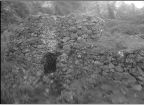
Horno de las canteras de yeso de Los Teatinos.

aquél paraje insólito y solitario. Entre otras razones, porque pese a que Aragoneses volvió por aquellas fechas, en repetidas ocasiones al lugar (la muestra de su paso todavía se conserva con una pica de hierro para soporte de una cuerda de pasamanos o quitamiados, puesta en un escalonamiento de la entrada por la bajada a la terraza inferior), quien suscribe nunca más hizo ese itinerario junto a él.