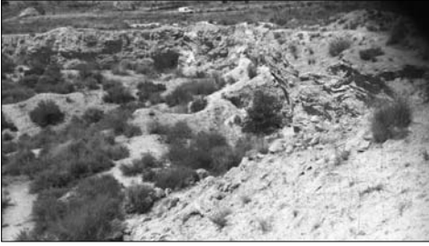
Horizonte de la cantera, propiedad de Los Tontinos en la carretera de Alcantarilla a Mula.

do y recóndito del lugar me ha pasado siempre desapercibido.