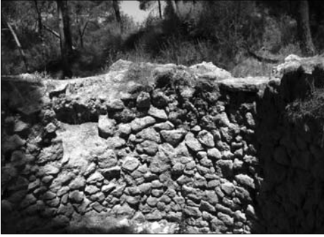
Restos de yeso en la base de la Balsa de agua del Valle-Carrascoy.