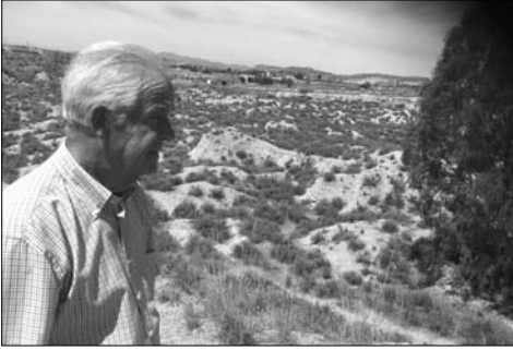
“El Tontino” mirando la Cantera que explotó su familia durante más de 150 años.

del camino sino a precio pactado. Mi bisabuelo deseaba, que el trabajo estuviese bien realizado, por tanto echaba exceso de yeso, que a veces iba en su perjuicio porque la demasía no se la pagarían. Es así, como algún gran hacendado, señorito ó representante municipal, un día le dijo: «... no eches tanto yeso y no seas “Tontino”, que al final vas a perder dinero». Esa misma expresión se repitió en más de una ocasión delante de otras personas que comprobaban el exceso de yeso y buen trabajo ejecutado con respecto a la soldada que recibía. A partir de entonces cada vez que se encargaba un trabajo de tal menester, se designaba al “Tontino”, por su mejor hacer y más barato que ningún otro. En tal sentido me honra haber pertenecido a una estirpe que su honor y credibilidad industrial se basó en la honradez y honestidad, tal y como he iniciado mi explicación.