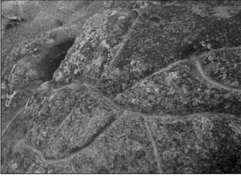
Petroglifo de "Los Teatinos".

res. A partir de ahí, tras levantar las cartas arqueológicas, se procedió a la publicación de la investigación realizada en la Revista Verdolay N12, 2009, del Museo Arqueológico de Murcia, bajo el título: "Los petroglifos del Parque Regional de El Valle (Murcia)".