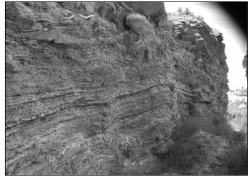
Cantera de yeso en el margen de la carretera Alcantarilla-Murcia.

La Región de Murcia se encuentra dentro de esa franja de terreno, actualmente un tramo del arco mediterráneo, que hace doscientos millones de años estaba sumergida bajo los mares. La evidencia la tenemos por la cantidad de yacimientos de aljez descubiertos desde los Montes Pirenaicos hasta Andalucía Oriental. Dentro de ésta planimetría abundan, incrustados y fundidos en las rocas, fósiles marinos de millones de años que demuestra la teoría del antecedente acuático en el territorio expresado.