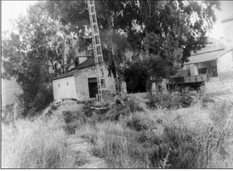
Vista de la Yesera "El Caracoles", 1945.

mulas. Mas tarde se compró un camión Austin, más tarde un Barreiros de unos 100 CV, y, finalmente, entre 1970 y 1974, cuatro camiones Pegaso de 160 CV diesel.