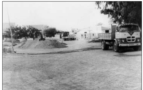
Industria Yesera “El Caracoles”, 1972.

Entendí que mi única solución, estudiando la situación de forma sensible y respetuosa, para acercarme al Grupo comercial “Caracoles”, debía pasar por acudir un día a sus dependencias comerciales. Y, es así como, a mediados de ésta última primavera, una tarde de sábado (día y horario que habitualmente aprovecho a lo largo del año, para mis trabajos de indagación y averiguación de cuanto sirva para complementar el aspecto de los textos que componen el artículo para ésta revista etnográfica), me acerqué al domicilio social de la