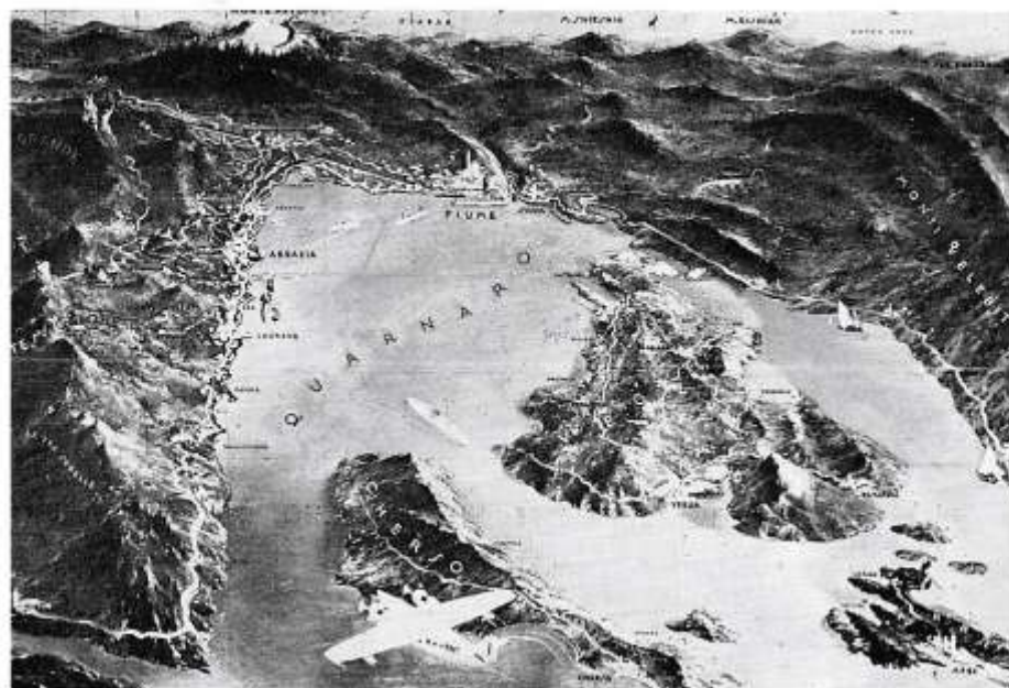
Una visione aerea immaginaria della Liburnia settentrionale

mentre i liburni e le città greco-romane della costa appoggiarono Cesare. Nel 49 a.C. le forze contrapposte di terra e di mare si affrontarono nella battaglia di Curicta (Veglia). Ne uscì sconfitto Cesare e le forze pompeiane rinforzarono la loro presenza nell'Adriatico. Solo dopo lo scioglimento del secondo Triumvirato, il nipote di Cesare e suo successore, Ottaviano, attaccò con consistenti forze i pompeiani e le forze che lo appoggiavano a Melita (Meleda) e a Corcyra Nigra, sbarcò a Senia (Segna) e si addentrò all'interno battendo a più riprese i Giapodi sino ad annientarli. Si calò infine, attraverso la Liburnia, nel paese dei Dalmati e li sconfisse distruggendo i maggiori centri di resistenza: Promona, Sinodio e Setovia. Questa campagna durò tre anni e cessò nel 33 a.C. Dai documenti di questo periodo, che gli storici romani lasciarono, abbiamo tratto la cartina della Liburnia che esponiamo qui nel contesto.