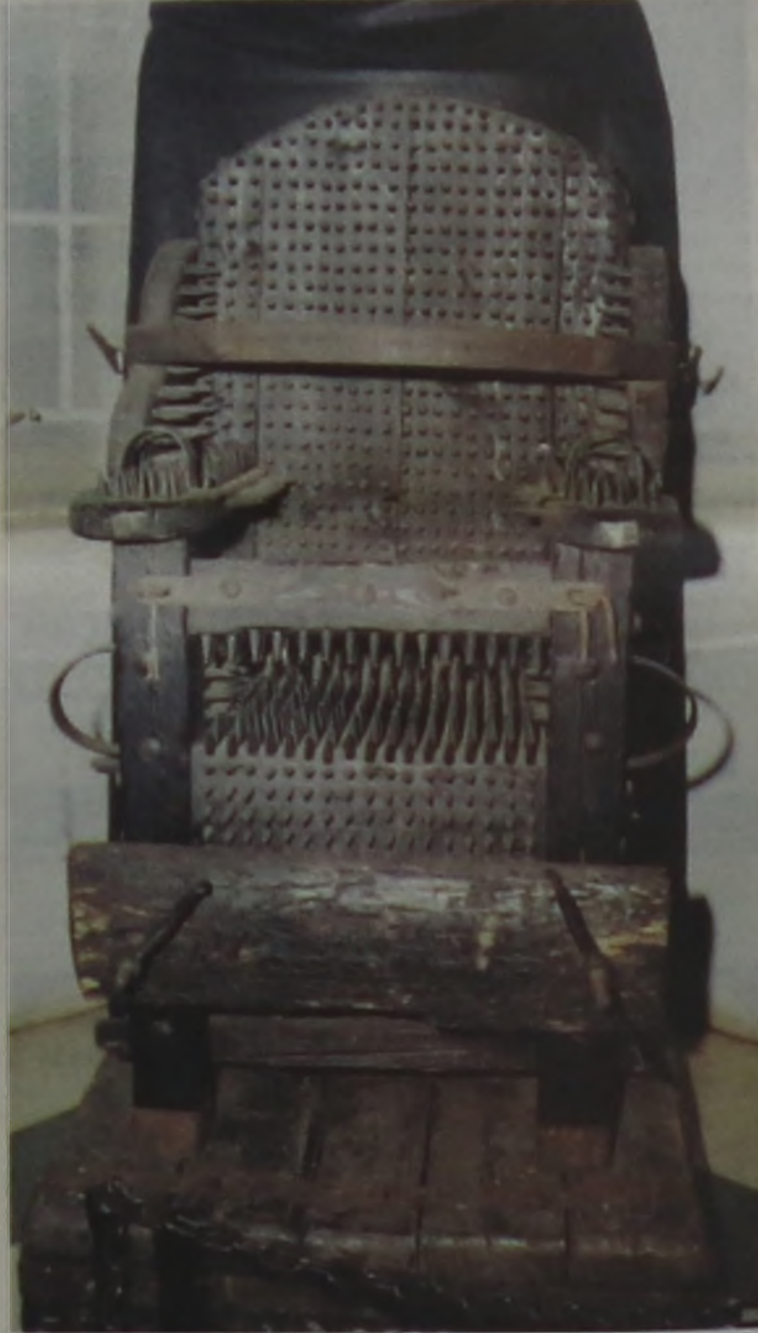
Cadeira de Inquisição: A cadeira tem 1606 pontas de madeira e 23 de ferro, era instrumento essencial usado pelo inquisidor. O réu devia sentar-se nu e com o mínimo movimento, as agulhas penetravam no corpo provocando dores horríveis. Em algumas versões, a cadeira apresentava o assento de ferro, que podia ser aquecido até ficar em brasas. Era usada até 1850

A exposição vai até o dia 28 de maio, em três horários: das 8 às 11h30, das 13 às 17h e das 19 às 21h.