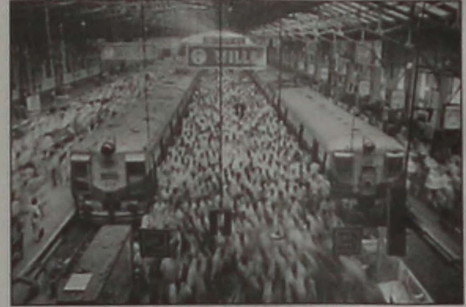
...ou as deslocamentos para outros países

Êxodos, exposição de fotografias de Sebastião Salgado, na Casa da Cultura, hoje e amanhã, das 9 às 21h.