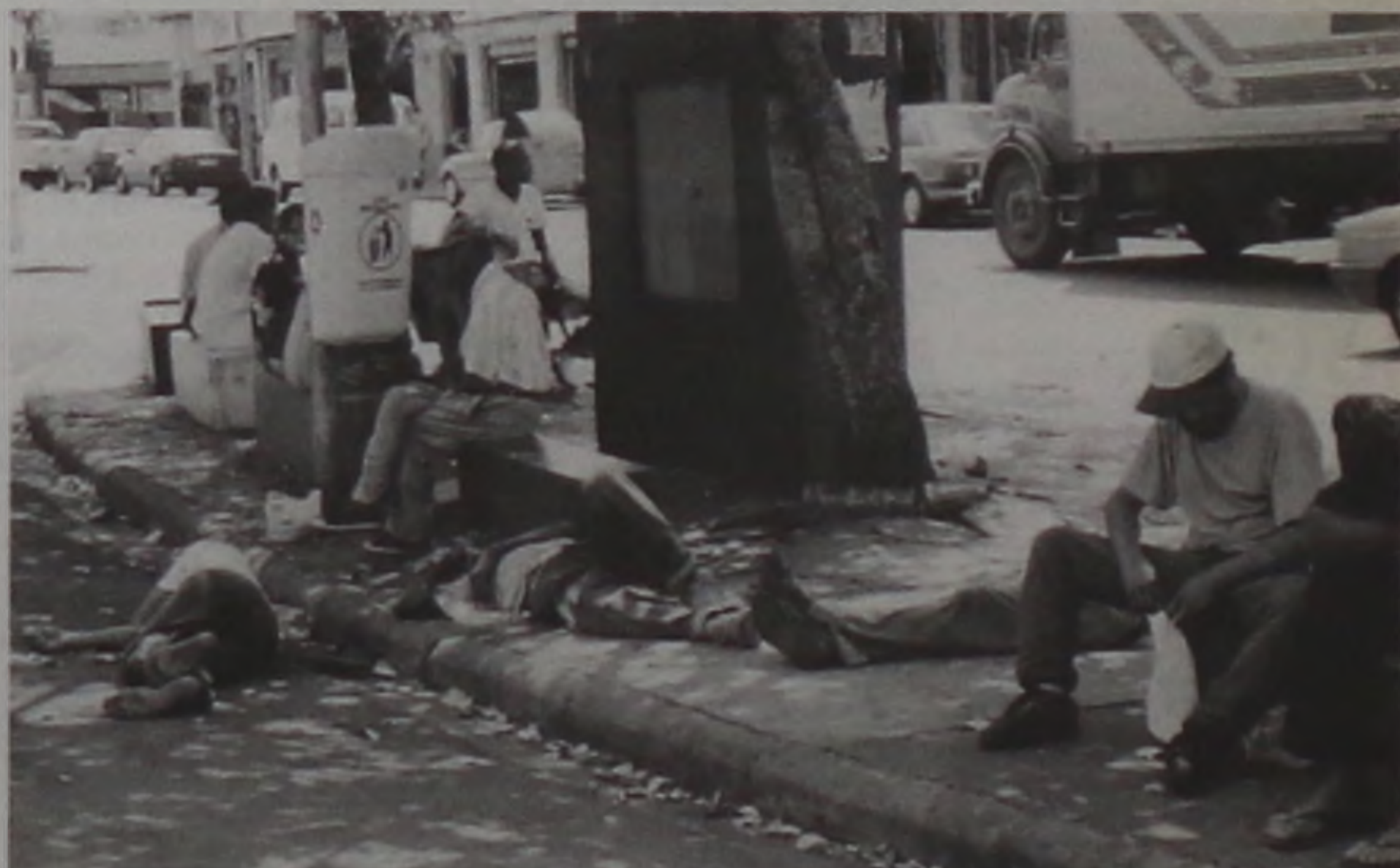
O clone da realidade não é filme e nem novela para os lençoesenses