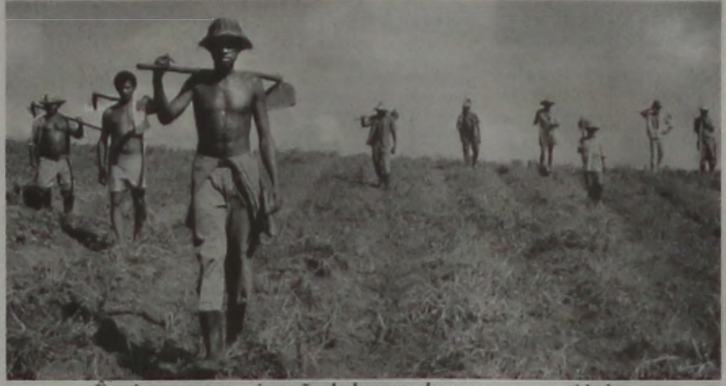
Êxodos retrata a migração do homem do campo para a cidade...

"Minha maior esperança é provocar um debate sobre a condição humana do ponto de vista dos povos em êxodo de todo o mundo. Minhas fo-