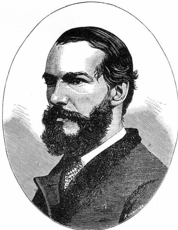
RUFINO JOSÉ CUERVO

MANUEL SECO de la Real Academia Española