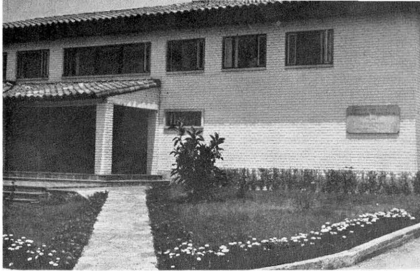
ASPECTO DE LA ENTRADA PRINCIPAL DE LA «IMPRESA PATRIÓTICA» DEL INSTITUTO CARO Y CUERVO, EN YERBABUENA.

Creada en julio de 1960 con ocasión de conmemorarse el Sesquicentenario de la Independencia Nacional, tomó su nombre de la que fundó en Santafé, en 1793, el Precursor Antonio Nariño. Constituye la unidad técnica que ejecuta el plan editorial para divulgar el resultado de las investigaciones científicas del Instituto.