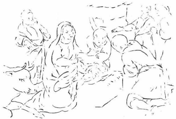
(Dibujo de Gregorio Vázquez Arce y Ceballos)

Ludwig Pfandl expresa en su Historia de la literatura nacional española en la Edad de Oro : "El villancico puede tener el número de versos que se quiera, pero se mueve de ordinario entre dos y cinco. El número de sílabas de los versos cambia dentro de una misma canción y oscila en general entre cuatro y doce. Estróficamente consta el villancico del tema o estribillo, que precede siempre, de la parte principal o copla, y de la repetición del estribillo que se llama vuelta o tornada . Asunto pueden serlo todas las formas imaginables de expresión o de materia poética.