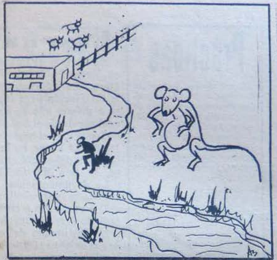
¿Dónde están las ratas que denunciaron esos exagerados de la Federación de Entidades de Bien Público?

brica de una planta decantadora y el correspondiente entubamiento del desagüe hasta la colectora de la ruta 2, se esperará el vencimiento de dicho plazo para iniciar las acciones pertinentes.