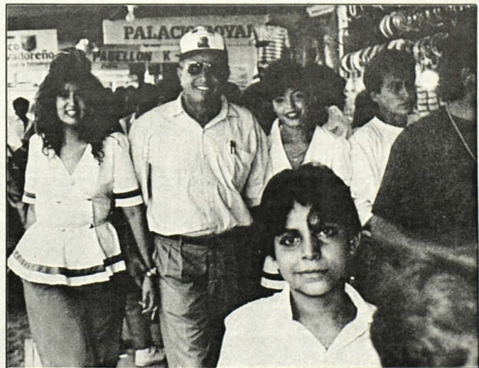
VISITANTES (San Miguel). La VIII Feria Industrial de San Miguel, nuevamente está abierta al público, donde todos los visitantes, pueden comprar los artículos y productos, que exhiben más de doscientos expositores. Un aspecto de una área de exposición.

"En otro país hay que adaptarse ¿y si no se puede?; en el aspecto artístico podría irme mejor porque hay más apoyo, pero se necesita tener espíritu aventurero incluso para emigrar", añade.