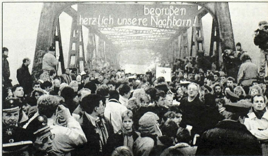
ESTE Y OESTE SE ENCUENTRAN. (Berlín, Nov. 14). El pueblo alemán se reencuentra sobre el puente Masandra al final de la calle Stuibäen-

Cualquier nuevo acuerdo tendrá que ser aprobado por las dos terceras partes de voto de los 23 miembros del Senado, donde el sentimiento en contra de las bases es sumamente fuerte.