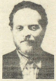
CONDENADO. Moscú, agosto, 28. Foto de archivo del sacerdote ruso ortodoxo Gleb Yakunin, condenado a trabajos forzados.

La agencia TASS dijo —Favor pase a la página 29.