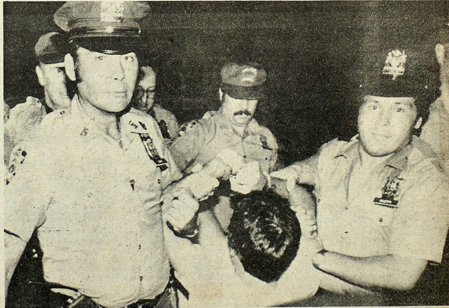
CARGAN A MANIFESTANTE. Nueva York, agosto 7. La policía remueve a un demostrante frente al Centro Islámico, en Nueva York, donde estudiantes iraníes estaban albergados. Se reportaron varios heridos.

Sayaf Ful, un líder guerrillero afgano, declaró a The Muslim que la colaboración entre los insurgentes —Favor pase a la página 37.