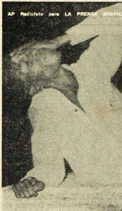
REFUGIADO. Miami, Florida, 30 agosto (AP). Uno de los 132 haitianos que hicieron viaje de 15 días desde Haití, muestra su canchero a su llegada a Miami.